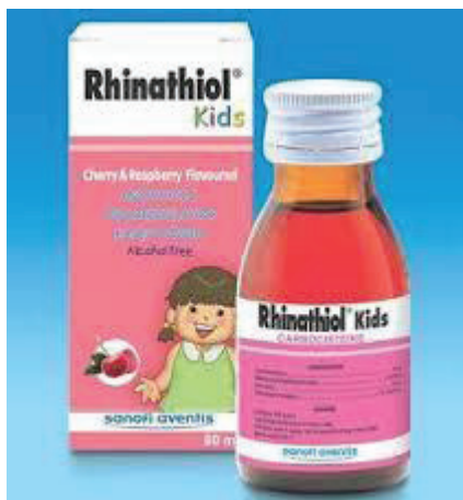
ยารักษาโรค