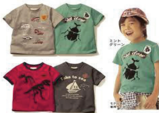
เครื่องนุ่งห่ม